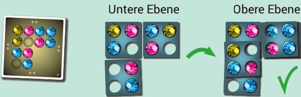
Unvollständige untere Ebene